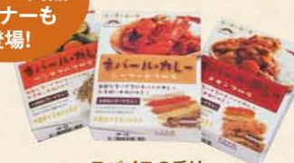
スパイスの香り 豊かなカレー