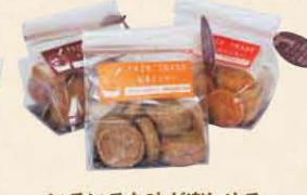
いろいろな味が楽しめる クッキー