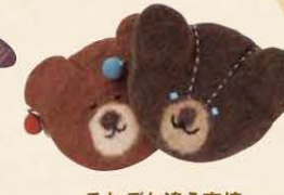
それぞれ違う表情 のフェルトベア