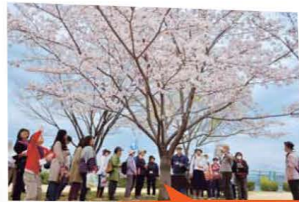
桜のスイーツウォーキング。 瑞ヶ池公園には米国ワシントンD.C.からの里帰り桜も。