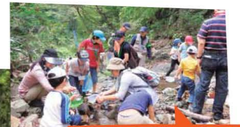
水辺の生き物探検では、水質調査も体験。カニや貝など、予想以上に多くの生物に出会える。