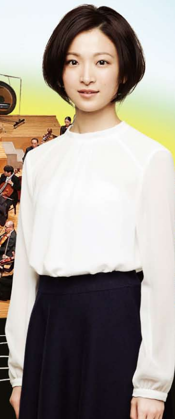
〈ナビゲート〉野々すみ花（元宝塚歌劇団宙組トップ娘役）